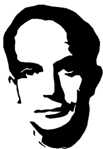
Willy-Bokler-Ehrenzeichen DJK-Diözesanverband Limburg